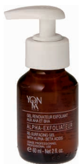
P. 60 ml